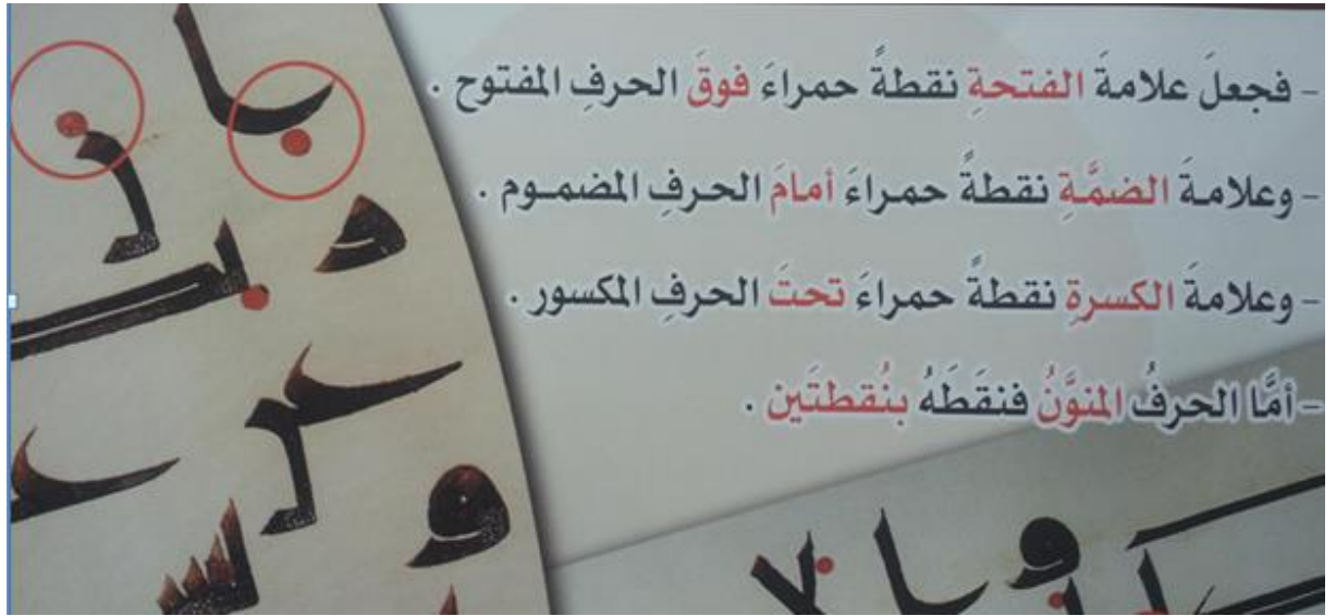
مراحل تطور الكتابة وضبط المصحف