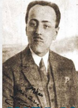
Enis Behiç Koryürek (1892-1949)