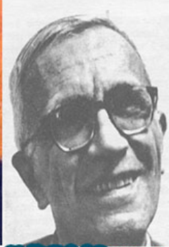
Halit Fahri Ozansoy (1891-1971)