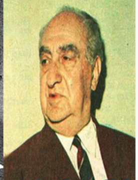
Faruk Nafiz Çamlıbel (1898-1973)