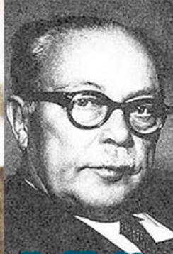
Yusuf Ziya Ortaç (1895-1967)